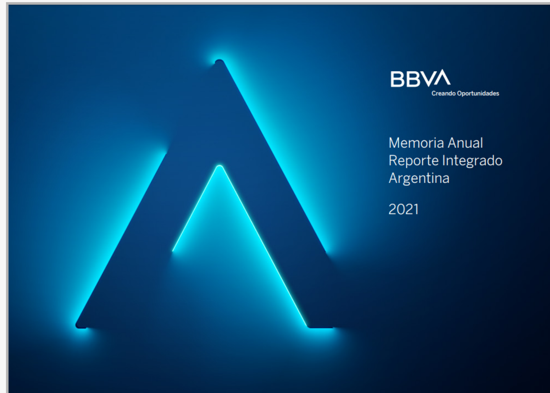
Memoria Anual | Reporte Integrado Argentina (Archivo PDF)