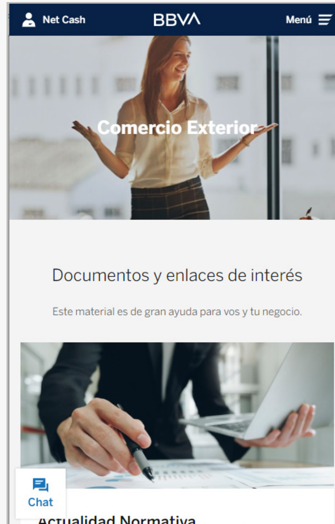
Comercio exterior para empresas